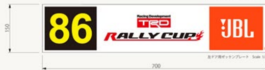
リア用ゼッケンプレート Scale 1/5