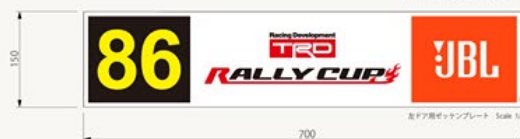
リア用ゼッケンプレート Scale 1/5