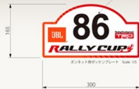
フロント用ゼッケンプレート Scale 1/5

ベースとなるラリープレートは貼り付けたまま ラリー毎に数字の切り文字のみ張り替える