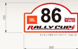
フロント用ゼッケンプレート Scale 1/5

ベースとなるラリープレートは貼り付けたまま ラリー毎に数字の切り文字のみ張り替える