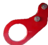
5 / 6