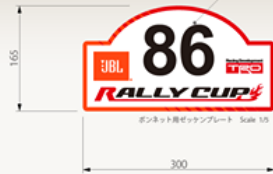
フロント用ゼッケンプレート Scale 1/5

ベースとなるラリープレートは貼り付けたまま ラリー毎に数字の切り文字のみ張り替える