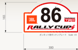
フロント用ゼッケンプレート Scale 1/5

ベースとなるラリープレートは貼り付けたまま ラリー毎に数字の切り文字のみ張り替える